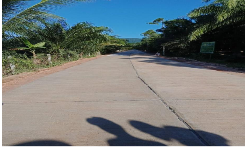
๔.โครงการซ่อมสร้างถนนลาดยางแอสฟัลต์ติกคอนกรีต สายสีแยก-ป่าอมบ้านคลองคราม หมู่ที่ ๘